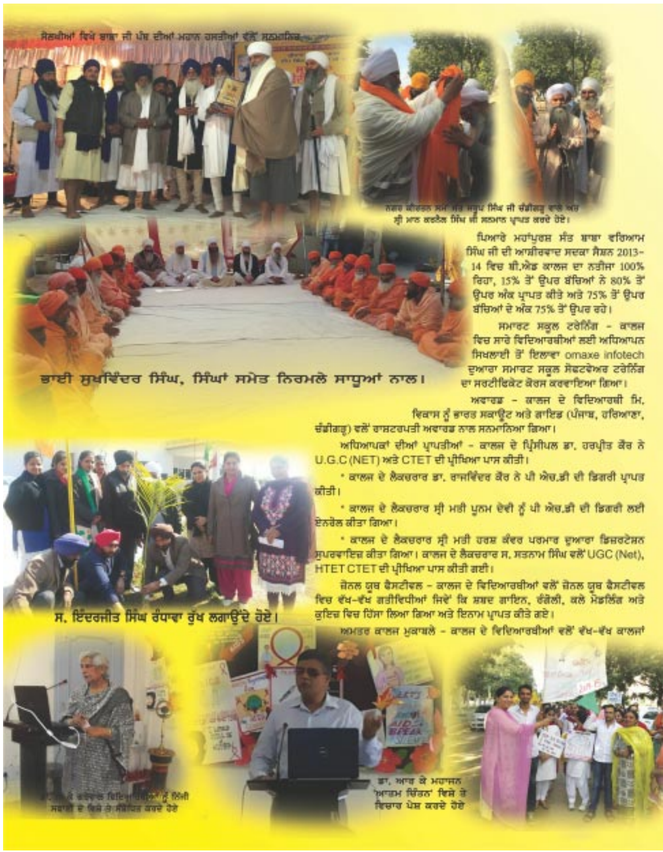
ਸੋਲਾਹਵੀਆਂ ਵਿਖੇ ਬਾਬਾ ਜੀ ਪੰਚ ਦੀਆਂ ਮਹਾਨ ਹਸਤੀਆਂ ਵਲੋਂ ਸਨਮਾਨਿਤ