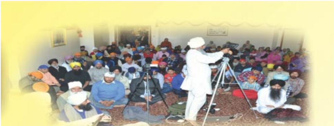
ਗੁਰਦੁਆਰਾ ਸਿੱਖ ਸੰਗਤ Indianapolis ਵਿਖੇ ਸੰਗਤ